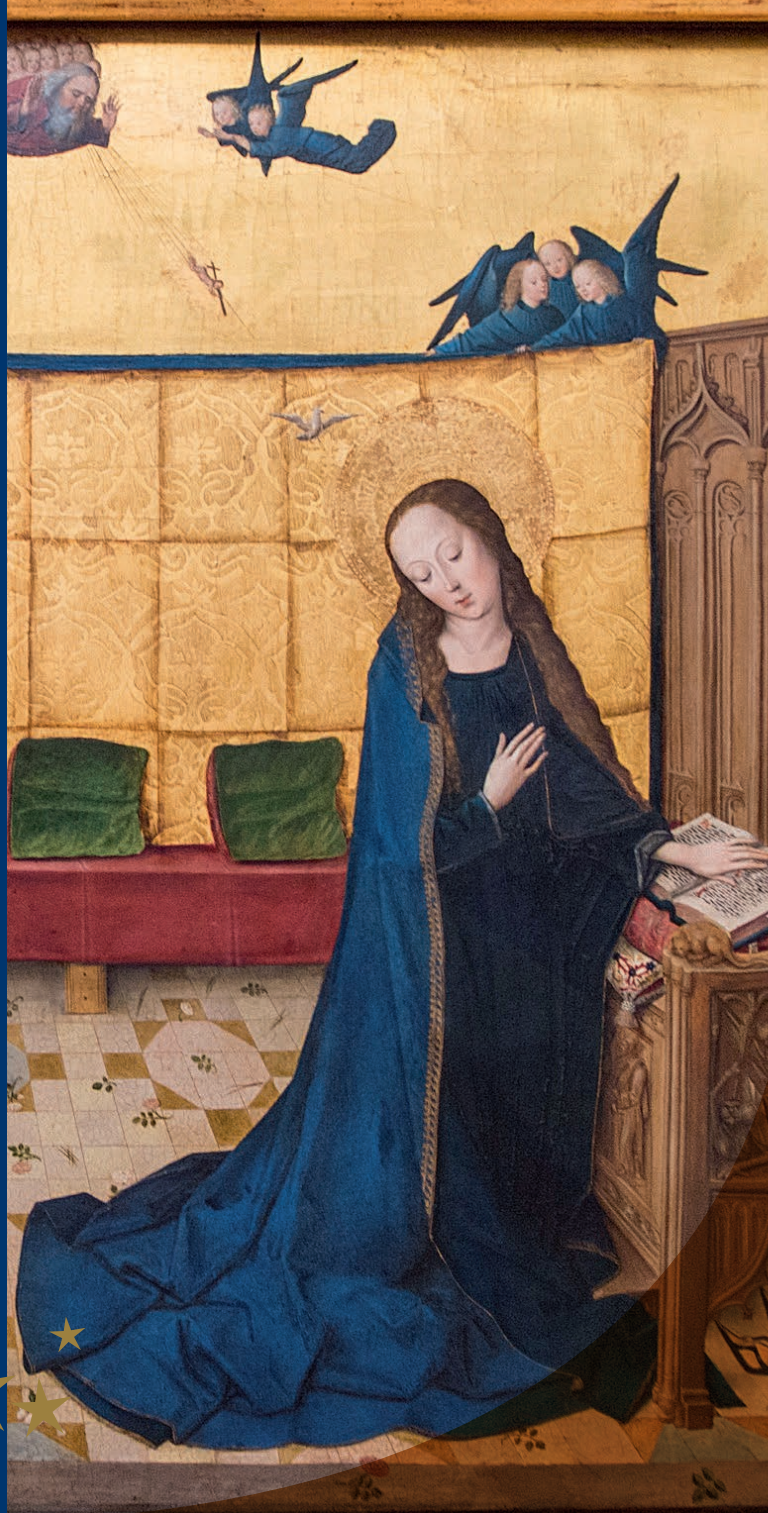
Ausschnitt: „Verkündigung an Maria“, Meister des Marienlebens, tätig in Köln um 1460/90, Alte Pinakothek, München